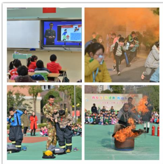
疏散演练强化安全意识

闸北实验小学教育集团始终坚持“安全是学校教育工作的底线，教育不能没有安全，安全离不开教育。”学校的稳定是学生得以健康成长的必要保证。为此，我校以创建上海市安全文明校园为主要抓手，针对集团各校区校园安全文明的各个环节，建立集团校园安全管理网络。按照“谁主管，谁负责”的原则，层层落实岗位责任。集团三校区分别成立以执行校长为组长的安全文明校园创建活动领导小组，成员由各校区中层领导等组成，建立由领导小组成员、年级组长、班主任为骨干的管理队伍，聘请法制辅导员为法律顾问。集团校长为第一责任人，各校区执行校长作为三校区第一责任人。校长与执行校长、执行校长与校区各部门分别签署责任书。各校园安装有完善的安全技防设施，专业公司对设施定期检查维护保养。各校区配有保安 24 小时全程护校，社区民警、街道保安、家长志愿