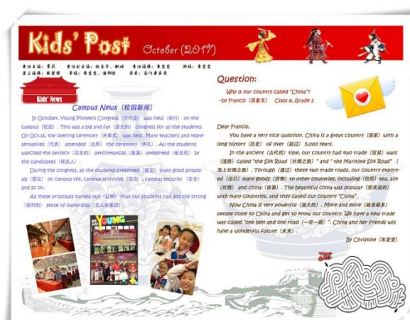
Kids' Post 有声英语报

校园网络文化作为学校文化的一种新型载体，对学校的文化建设产生着重大的影响。为此，我们从搭建网络平台入手，根据校园文化内涵与学校的发展，形成校园网版面的若干个主题模块，并在每个主题模块下包含了多方面内容。在此基础上，开展丰富多彩的校园网络文化活动。如组织教师积极开展教师网上专题内容的学习和讨论、网上论坛、网上教研组活动等，展示我校教师积极投入扎扎实实的教学改革实践的精神风貌；引导学生学先进、创文明、争优秀，凸显实小少年的精神风貌；开展教师与家长的双向交流活动，让更多的家长真正地、全面地了解我们学校，参与我们学校的相关工作，丰富了传播文化的途径，健康文明、丰富多彩的网络文化活动，让校园内处处充满学习的氛围。