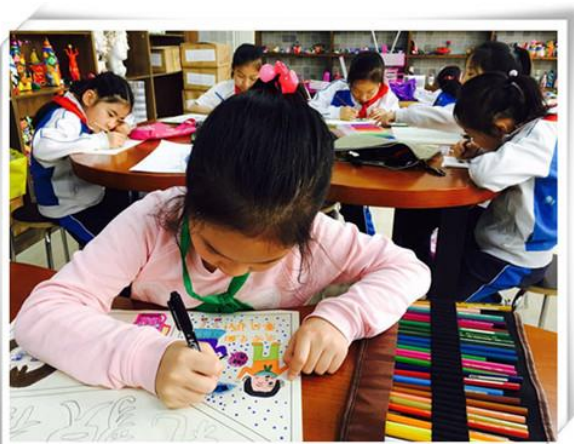
“好习惯伴我成长”绘画比赛

学校还以开学典礼、毕业典礼、升旗仪式、入队仪式等为契机，有针对性地开展特色主题教育活动，凝聚引领师生。学校依托校本课程的系列化实施，开展“好习惯伴我成长——绘画比赛”、“生活达人秀”、“光盘行动，从我做起”、“用爱心点燃希望，用行动播种阳光”红领巾手拉手等主题系列活动。学生们运用画笔牢记《小学生日常行为规范》九条规范，并内化于心，外显于稳定的行为，形成良好行为规范。同时，他们不仅带动家人一起宣传光盘行动，践行惜物节俭的美德，传承着中华民族优秀传统文化，还与云南省文山州贫困小学、上海的“宝贝之家”等地开展援助活动，将爱传递。少年梦，中国梦，学生们为了远大志向而不懈努力着。他们树立起当代学生应有的言行风范，为营造优良的社会道德风尚作出贡献，社会主义核心价值观融在学生心中扎根、开花。