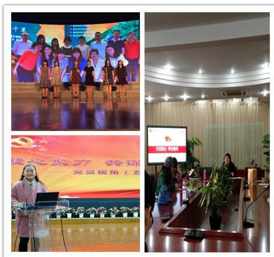
两学一做 创先争优

学校始终认真贯彻落实党的十八大、十九大重要精神、认真学习习近平同志系列重要讲话，深入贯彻市第十一次党代会精神，支部严格按照推进“两学一做”学习教育常态化制度化实施要求，认真抓好各项重点任务落实，开展党建创新项目实践，切实提升学习教育的针对性和实效性。一是找准问题，精准发力。推进学习教育常态化制度化，必须树立强烈的问题意识和问题导向，把解决问题作为突破口和主抓手，在不断查找解决问题中深化学习、检验实效。开展“补短板 促优化”活动，听取教职工的意见和建议，认真查找问题，随后进行支委民主生活会，提出整改措施。对整改情况严格督办，能够立即整改的就立即整改，不能立即整改的