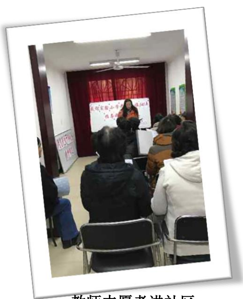
教师志愿者进社区

雷锋精神是时代的需要,是社会的呼唤,是不朽的丰碑,是我们永远的榜样。学校全体师生员工始终以传承雷锋精神作为自己的动力源泉和行动榜样,坚守着自己的承诺,实现着自己的理想。学校师生员工志愿者覆盖率不低于 40%,参与志愿者活动平均每年不低于 6 小时;党员中的志愿者覆盖率 95%以上,参与志愿者活动平均每年不低于 12 小时。