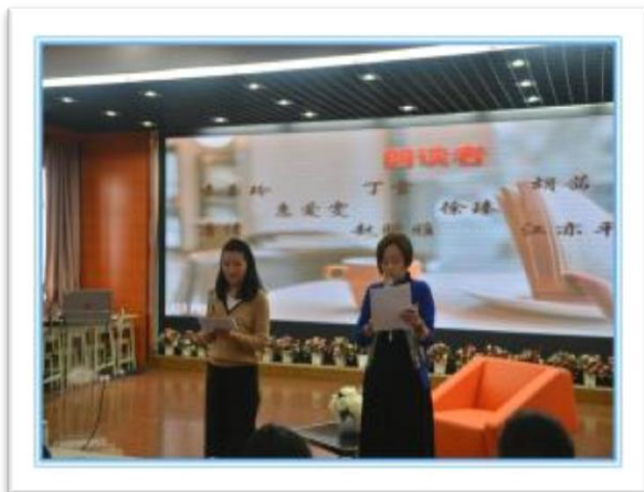
“悦读”系列活动之“微朗读”

靠三个校区的工、团组织，让集团教工“学起来，动起来，活起来”，着重在教师文化层面凝练人文内涵，倡导关怀文化、合作文化、诚信文化、创优文化，提炼人文精神，有效支撑闸北实小教育集团化办学。