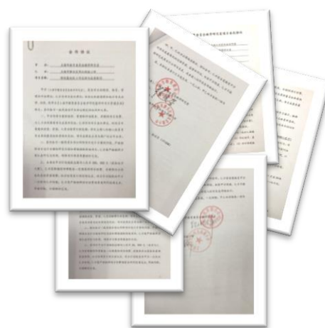
与市教委签订项目协议

同时，我校作为上海市教委教研室教育综合改革实验基地校，2017 年综改项目步入深水区第三年，学校在更宽泛的层面上围绕课程建设、队伍建设、空间建设等领域开展探索和成果推广。一年来，学校与市教研室签订项目合作协议，组织并落实全学科教师开展《学校课程领导力提升的实践案例研制》、《学业质量