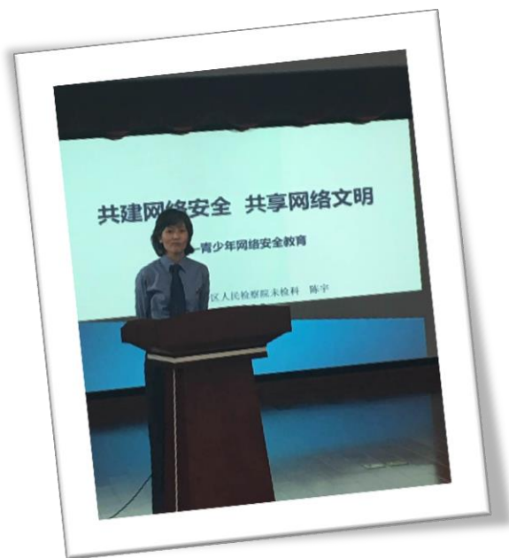
检察官进校园普法

《中华人民共和国教育法》、《中华人民共和国教师法》、《中华人民共和国义务教育法》、《教师资格条例》、《上海市青少年保护条例》、《教师师德条例》等是学校经常涉及的教育法规。作为学校管理者和每一位教育工作者都必须知晓和了解的。多年来，学校结合学校章程、学校各项规章制度(学校法规)十分重视“法”的教育普及，有针对性的开展相关法律教育普及活动。学校注重学法与实际结合，渗透“生命教育”、“安全教育”、“社会警示教育”，还请来了检察官、法官开展“法治进校园”活动，诸如“法轮功”的社会危害，“毒品”的危害和“网络安全”教育等等，让它们走进“怎么办”自理自省课程中，师生间的学法互动，让孩子们从小知道“法律”的严肃性、尊严性，让学校的广大师生具有法律和自我保护意识。