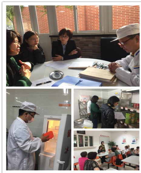
创建放心学校食堂

学校集团严把师生食堂食品卫生关，在创建“放心食堂”工作中率先垂范。每学期开学前都要进行相关培训，做到食堂从业人员应知应会；每天检查食堂从业人员健康状况、留样食品。定期开展食堂规范操作及安全的检查。我们全面按照师生健康营养午餐的配置进行服务，每周在校园网、公示栏张榜师生菜谱，接受广大师生和家长的监督。2017 年下半年我校在由静安区教育局和静安区市场监督管理局组织的静安区学校食品